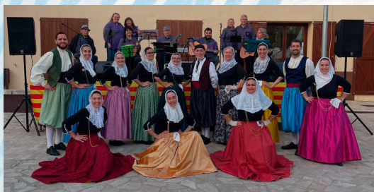
Mostra de música i ball agrupació cultural Brocalet Dissabte 9, 20'00 h.